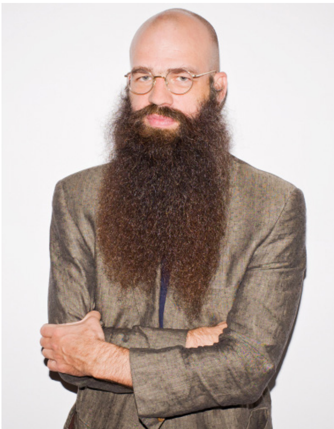
Porträt Julius von Bismarck

Stabilität und potenziellem Zerfall. Wie die Künstlerin sagt, «entspringt das Werk 'Step by Step Towards Home' der Reflexion über die Idee von 'Zuhause' und die unbewussten Bemühungen und die Vorsicht, die im Alltag verankert sind – insbesondere unter instabilen, transitiven urbanen Bedingungen und sich verändernden Identitäten. Indem ich auf einem vom Menschen geschaffenen, unsicheren Pfad gehe, erforsche ich den Prozess, nach und nach durch jeden einzelnen Schritt ein Gefühl der Zugehörigkeit aufzubauen. Dies ist ein innerer Zustand und zugleich eine Form poetischer Arbeit.» Die Plattform zeigt nicht nur ein vergrössertes Muster traditioneller Mosaikfliesen. Es ist auch ein psychosensorischer Raum, insofern das Mosaikmuster ein Fragment der Erinnerung ist, welches die Künstlerin schrittweise durchquert. Der Boden ist nicht länger nur ein Raum, der den Körper trägt, sondern eine geschichtete Ansammlung von Erfahrungen. Er ist uneben und inkonsistent. Eine volle Wasserschale haltend vorwärts zu gehen wird für die Künstlerin «zum Sinnbild für Emotion, Identität, Verantwortung und Verletzlichkeit. Die Hand darf nicht zittern. Der Fuß darf nicht ausrutschen. Jeder Schritt muss mit voller Achtsamkeit gesetzt werden.»