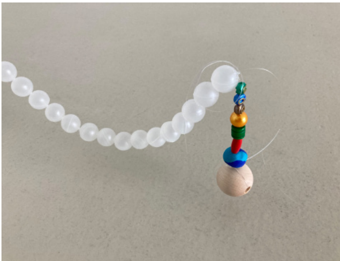
Oben : Porträt Jos Näpflin, Courtesy der Künstler Unten : Jos Näpflin, TOT(EM) , seit 2007 (Detail), Courtesy der Künstler

Von Jos Näpflin (*1950, Zürich) sind im Raum 5 schwingende Arbeiten zu sehen, die wie ephemere, schwebende Girlanden aussehen. Unterschiedlich lang scheinen sie zwischen Decke, Wand und Boden die Zeit anzuhalten. Seit vielen Jahren arbeitet der Künstler an der Schnittstelle von Skulptur, Installation und prozessbasierter Praxis. Seine Werke zeichnen sich durch eine präzise, oft reduzierte Formensprache aus. Subtil werden Materialien, Kräfteverhältnisse und räumliche Situationen austariert. Häufig stehen latente Spannungen und minimale Eingriffe im Zentrum – Arbeiten, die weniger behaupten als verschieben und die Wahrnehmung für das Unspektakuläre schärfen.