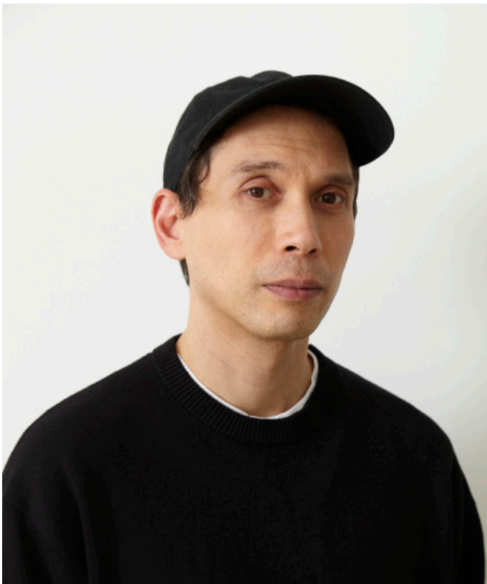
Porträt Josh Kline

Mit Josh Kline (*1979, Philadelphia) tritt die Dimension der umfassenden Entwertung von Arbeit innerhalb der neuen entgrenzten Formen von Kapitalismus auf die Bühne. In Raum 6 ist eine kondensierte Auswahl aus den Werkgruppen «Blue Collars» und «Social Media» zu sehen: ein präzises, materialbasiertes Bild gegenwärtiger Arbeitsverhältnisse – und ihrer Erosion. In der Serie «Blue Collars» richtet sich der Blick auf den Körper von Arbeit:innen. Kline arbeitet hier mit hochauflösenden 3D-Scans realer Personen, deren Körper anschliessend mittels industrieller 3D-Druckverfahren reproduziert werden. Werke wie «Saving Money with Subcontractors» (Fedex Worker’s Hand with Pad) von 2015 zeigen fragmentierte Körperteile, groteske Stillleben der Konsumgesellschaft. Die