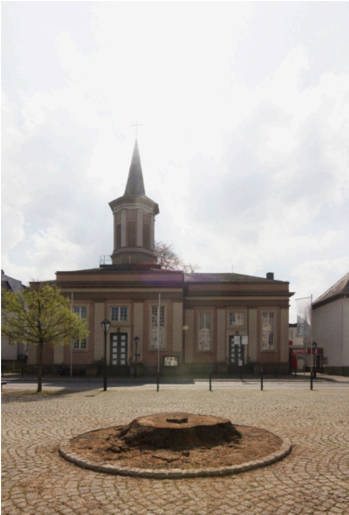
Julius von Bismarck, History Apparatus , 2014, Installationsansicht Neumarkt Arnsberg, Courtesy der Künstler

sheit. Viele seiner Arbeiten verbinden menschliche Körper mit natürlichen Prozessen – Wind, Wasser, Feuer – und erzeugen subtile Spannungen zwischen Schönheit und Bedrohung.