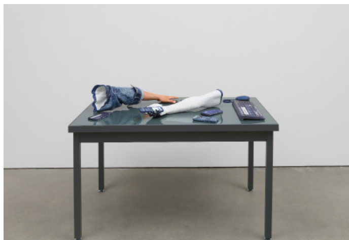
Oben : Josh Kline, Saving Money with Subcontractors (Fedex Worker's Hand with Pad), 2015, 3D-gedruckte Skulpturen aus Gips mit Inkjet-Tinte und Cyanoacrylat, gegossenes Urethan, Schaumstoff, Verpackungschips, Vinyl, Karton, MDF, 91,44x30,48x88,90 cm, Auflage von 3 plus II AP, Abbildung courtesy der Künstler und 47 Canal, New York. Foto: Joerg Lohse