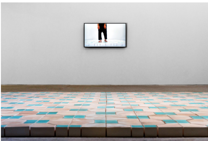
Oben : Porträt Annie Wan Lai-kuen

Eine transformative Dimension eröffnet sich am Ende des Parcours nochmals mit dem Motiv des reinigenden Wassers in der poetischen Bodenskulptur «Step by Step Towards Home» (2026) von Annie Wan Lai-kuen (*1961, Hong Kong). Die neue, für die Ausstellung in der Fondation Fernet-Branca entstandene Arbeit besteht aus einer physischen Plattform aus rund 700 glasierten, hohlen Keramikblöcken, von Hand gegossen und einzeln zusammengesetzt, was eine Gesamtfläche von ungefähr 250 x 670 cm ergibt. Ergänzend dazu ist eine Videoarbeit zu sehen, eine Aufnahme der Künstlerin, die während rund 10 Minuten langsam über die Keramik-Plattform geht, dabei eine Keramikschale mit Wasser tragend, offensichtlich in Fürsorge für etwas, das leicht zu verschütten ist, ein Verlust, den es zu verhindern gilt.